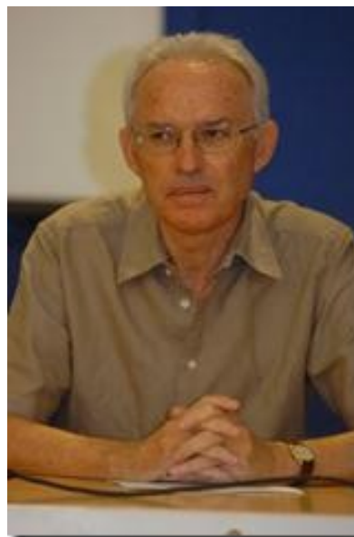
SECRETARÍA TÉCNICA DE LA COORDINADORA

Que sean consecuentes con los programas políticos que les llevaron al poder, puesto que el pueblo, los ciudadanos, les han elevado hasta allí atendiendo a las promesas que esos programas contenían. De no hacerlo así, es indudable que pierden toda la legitimidad democrática que les llevó a ostentar ese poder y la ciudadanía burlada estará en su pleno derecho de apelar a la desobediencia civil.