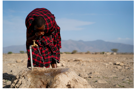
Programa de canalización de aguas para la población masai en Tanzania.

Traerá credibilidad en nuestro trabajo que a día de hoy es muy importante en la labor que realizamos las ONGs ya que muchas veces, por desgracia, hay una desconfianza grande en la gestión de los fondos que se reciben