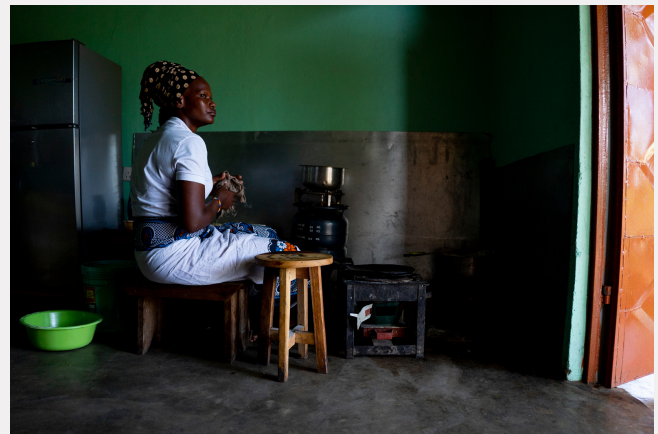
En las fotos algunas de las mujeres beneficiarias de los proyectos de Kutemba Na Tanzania.